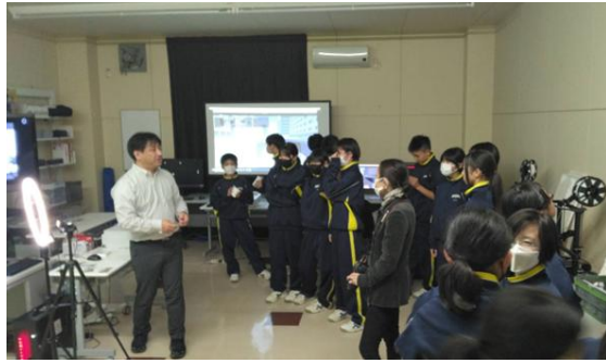
八戸工業大学（情報工学）