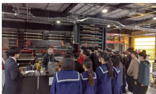
旭光通信システム