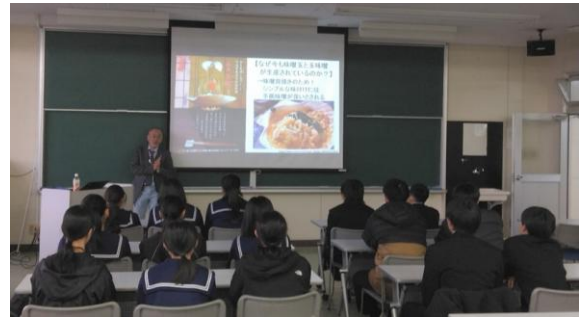
八戸工業大学（模擬講義）