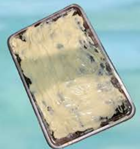
マヨネーズのり弁 (試作)